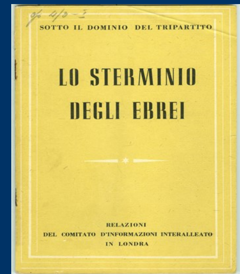
"Lo sterminio degli ebrei" Comitato d'informazioni interalleato in Londra, 1942"

1938 - 1945 LA PERSECUZIONE DEGLI EBREI IN ITALIA "Documenti per una Storia"