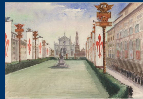
Bozzetto di piazza Santa Croce addobbata per la visita di Hitler Firenze - 1938

Le diverse sezioni illustrano - attraverso bozzetti, foto, documenti e giornali - la visita di Hitler del 9 maggio 1938; le leggi antiebraiche del 1938-1939 e i loro effetti: il censimento, la creazione della "Sezione ebraica" della scuola Regina Elena, l'espulsione dalla Pubblica Amministrazione, il ritiro della cittadinanza italiana, la censura dei libri. La penultima sezione presenta il momento più drammatico, quello della Repubblica Sociale Italiana e la tragica escalation di atrocità: sequestro di beni e di attività commerciali e loro vendite all'asta, arresti, detenzioni, il campo di internamento di Villa La Selva, deportazioni, invio ai campi di concentramento, fucilazioni. L'ultima sezione illustra quanto avvenuto dopo la liberazione: il rapporto della Comunità Ebraica con il nuovo sindaco Pieraccini, la restituzione dei beni sequestrati, la chiusura del campo di Villa La Selva.